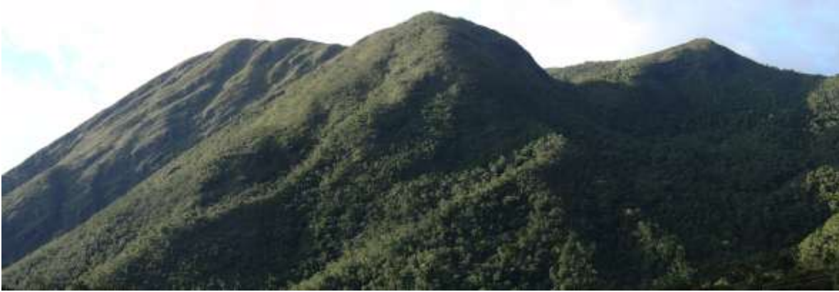
Vista noroccidente desde el centro de visitantes