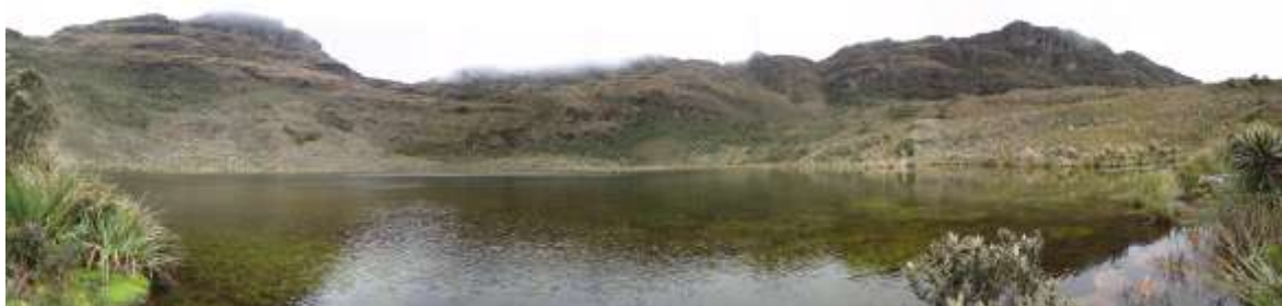
Montañas circundantes a la laguna sagrada - laguna de Iguaque

INTERPRETACIÓN AMBIENTAL: aquí el visitante podrá tener la oportunidad de: observar, conocer y vivenciar las formas en que nuestra ancestral madre naturaleza nos muestra su esplendor y grandeza, también podremos conocer parte de los legados de nuestros aborígenes MUISCAS dejados en el territorio bajo los lineamientos de respeto, contemplación sostenible y admiración.