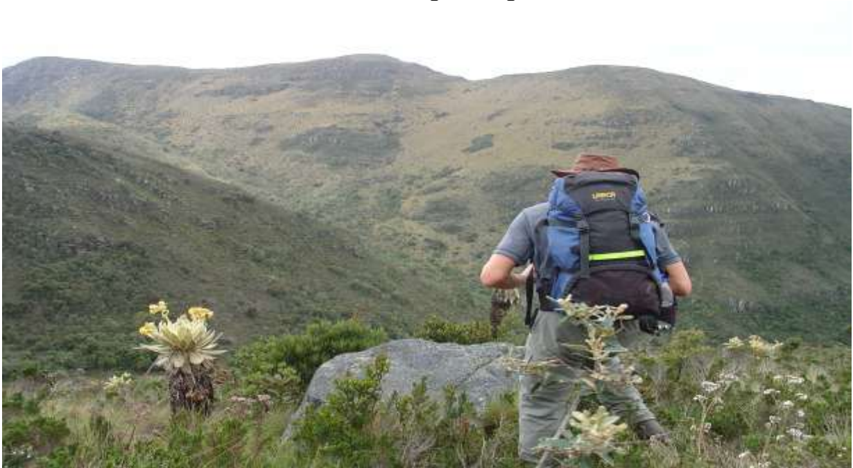
Desde el mirador de la laguna hacia el sur