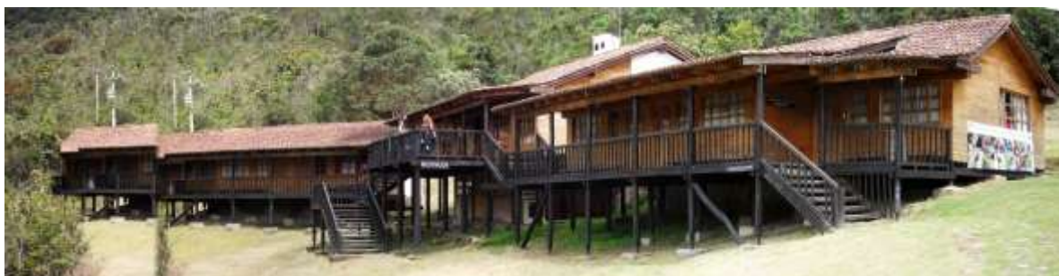
Vista general del centro de visitantes