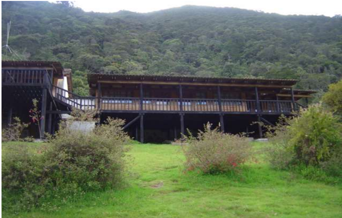
Centro de visitantes