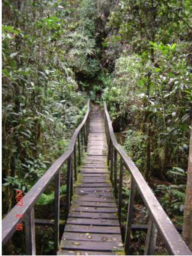
Puente Japae sobre la quebrada Carrizal

CONTACTO PARA RESERVAS: NATURAR – IGUAQUE