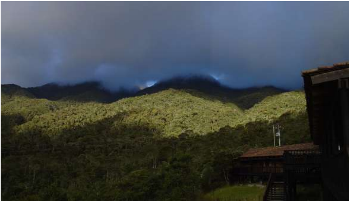
Vista al norte desde el Centro de visitantes