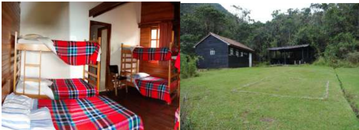
Vista interior del alojamiento, Zona de camping

ALOJAMIENTO: En el santuario el alojamiento se puede hacer según la preferencia, en el centro de visitantes que cuenta con cómodos refugios de montaña, dotados de servicios sanitarios, energía eléctrica y cercanía al restaurante; o en la zona de camping donde existe un espacio plenamente demarcado con servicios sanitarios y área comunal de preparación e ingesta de alimentos.