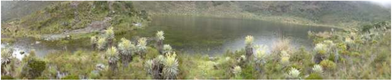
Laguna de Bachue / Iguaque