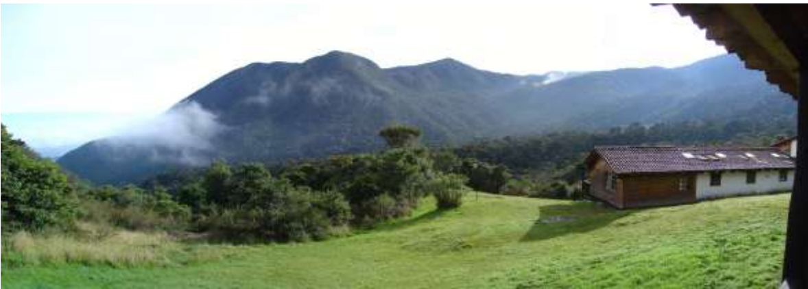
Centro de visitantes desde el inicio del sendero al mirador