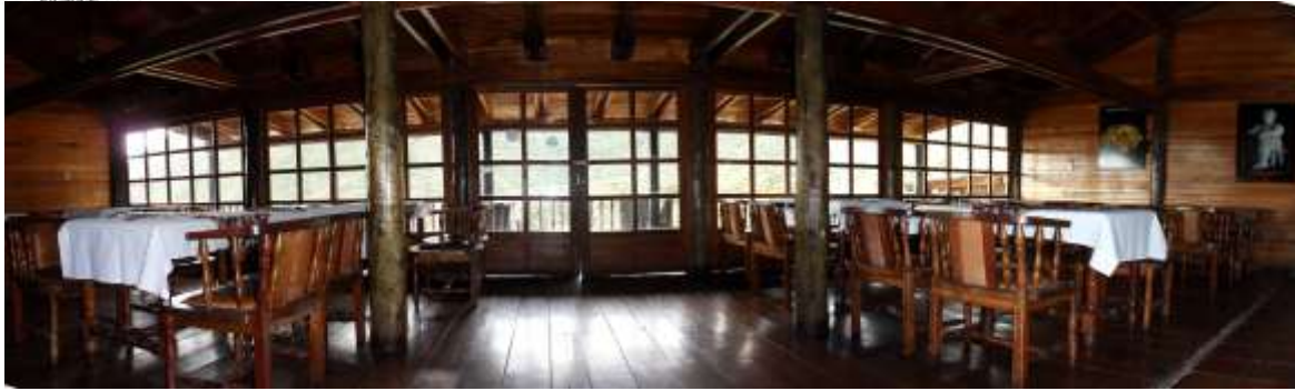
Vista del restaurante

ALOJAMIENTO: En el santuario el alojamiento se puede hacer según la preferencia, en el centro de visitantes que cuenta con cómodos refugios de montaña, dotados de servicios sanitarios, energía eléctrica y cercanía al restaurante; o en la zona de camping donde existe un espacio plenamente demarcado con servicios sanitarios y área comunal de preparación e ingesta de alimentos.