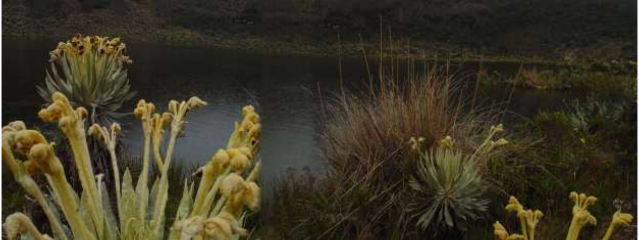
A la orilla de la laguna sagrada